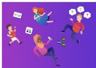
Iechyd a Lles