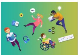
Ieithoedd, Llythrennedd a Chyfathrebu