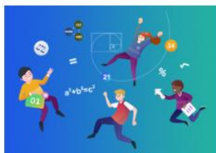
Mathemateg a Rhifedd