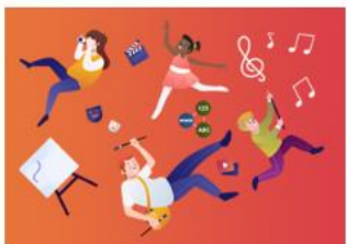
Y Celfyddydau Mynegiannol