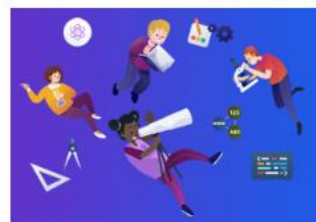
Gwyddoniaeth a Thechnoleg